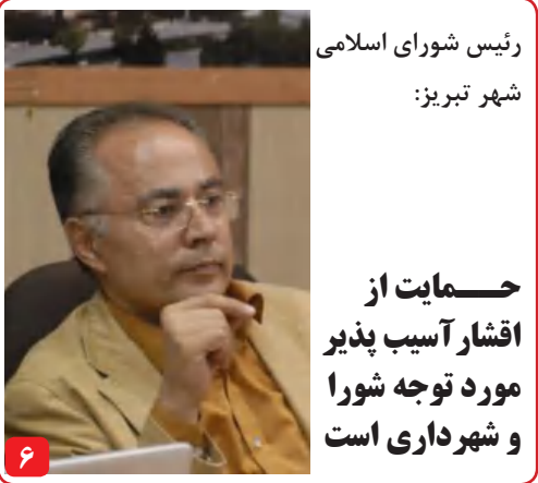
رئیس شورای اسلامی شهر تبریز؛