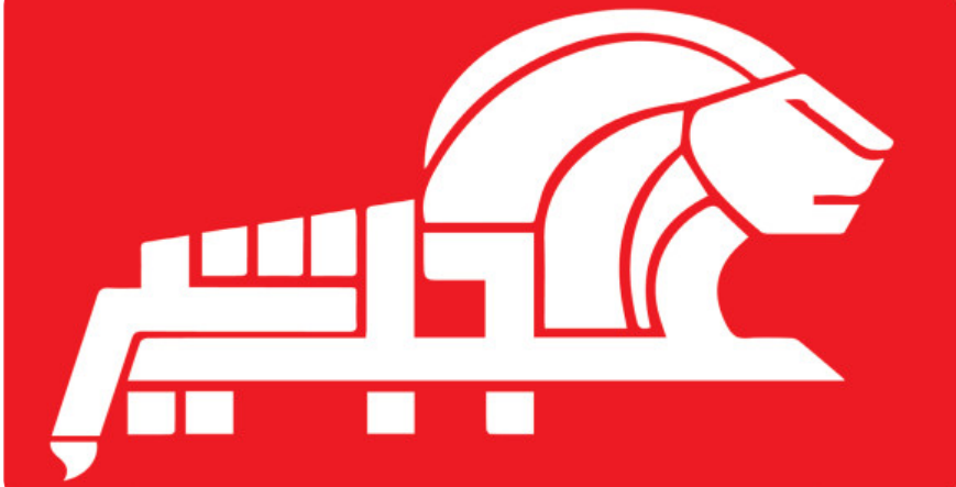
هفته نامه فرهنگی - اقتصادی