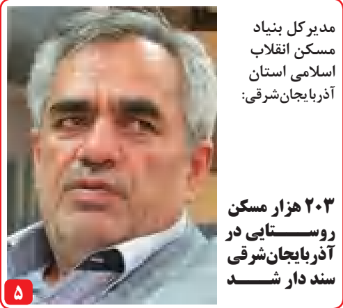
مدیرکل بنیاد مسکن انقلاب اسلامی استان آذربایجان شرقی؛