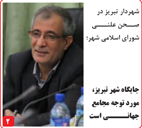
شهردار تبریز در صحن علنی شورای اسلامی شهر؛