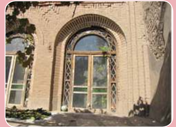
خانه ارغندی شیشوان