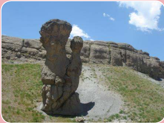
قیز قیه سی هر گلان