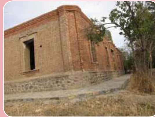
خانه اربابی جوانقلعه