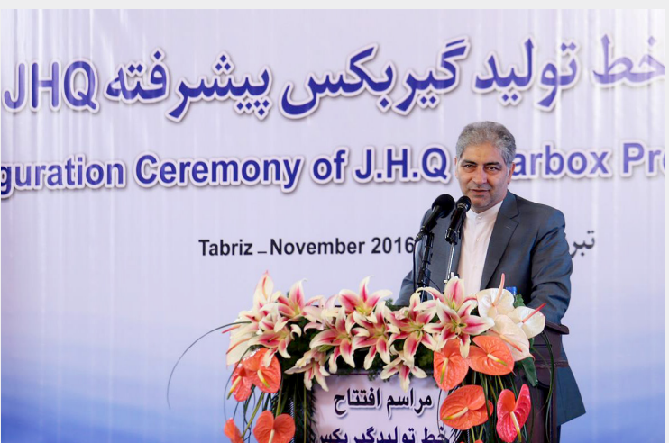
آرزوهای ملت ایران در حال تحقق است و روز به روز شاهد توسعه و بهبود اقتصاد کشور هستیم.

از برنامه های جانبی این روز می توان به اهدای کتاب به منظور تشویق اعضا و ارزش کتاب و کتابخوانی اشاره کرد و برپایی ایستگاه نقاشی و نوشتن آرزوها و دل نوشته های دانش آموزان بر روی بادبادک از دیگر برنامه های اجرایی بود.