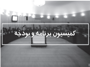
کمیسیون برنامه و بودجه