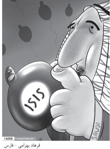
فرهاد پهرامی - فارس