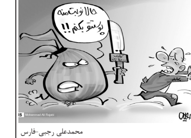
محمدعلی رجی فرانس