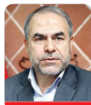
دکتر یدالله جوانی

یکی از ضرورت‌ها و اولویت‌های امروز کشور، تقویت بنیه دفاعی است و پشتوانه این ضرورت هم شرع مقدس، عقل، تدبیر و تجربه است. در شرایط کنونی کشور ما با تهدیدات گوناگون امنیتی مواجه است و بنابراین در شرایطی که کشور با تهدیدات امنیتی مواجه می‌شود باید این توانمندی دفاعی را حفظ کرد و افزایش داد. اما یکی از دلایلی که موجب می‌شود در مقطع فعلی این ضرورت بیشتر مورد توجه واقع شود و قطعاً دولت دوازدهم هم به آن عنایت خواهد داشت، اقداماتی است که آمریکایی‌ها با تحریم‌های جدید دنبال می‌کنند و در کانون تحریم‌های خود قدرت دفاعی جمهوری اسلامی ایران را هدفگذاری کردند و در پی آنند که بنیه دفاعی کشور ما را تضعیف کنند. ما در منطقه راهبردی غرب آسیا شاهد هستیم که عمده کشورهای پیرامونی ما