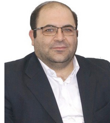
علیرضا جباریان قائم رئیس