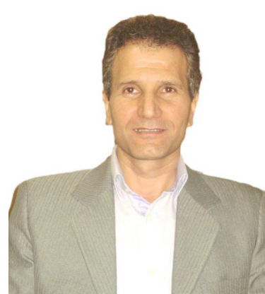
رسول افراشته نائب رئیس اول