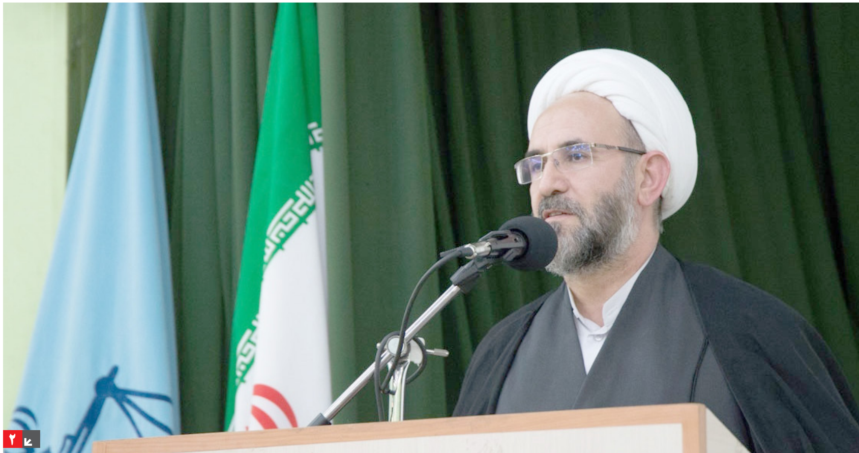
استاندار آذربایجان شرقی: