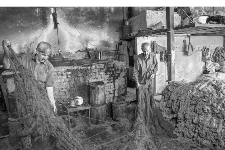
شادای رهبر صباغی

این صنعت از نمک‌های فلزی مانند زاج، مواد قلیایی و آب رنگ‌های بسیار زیبایی را خلق می‌کردند.