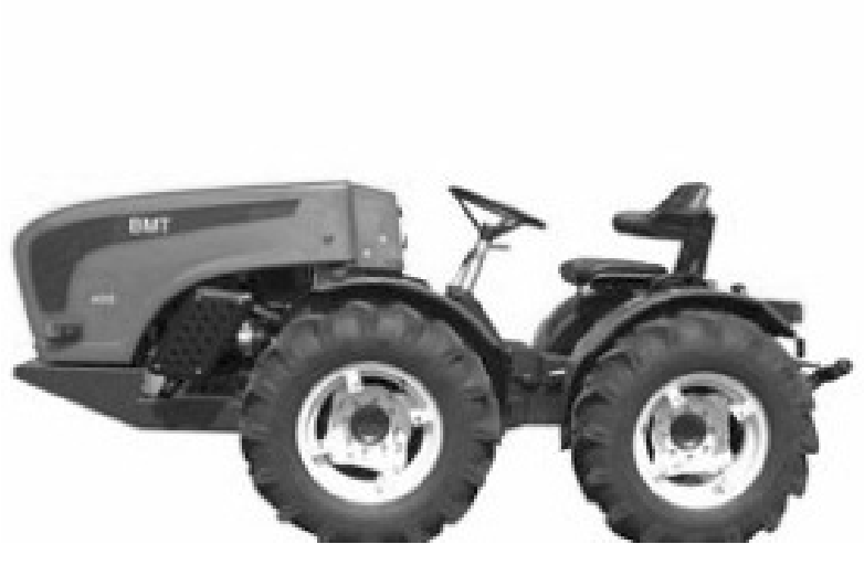
خودروی بدون گیربکس و دیفرانسیل در تبریز

است. این فعال عرصه صنعت استان آذربایجان‌شرقی گفت: خودروهای موجود در بازار قابلیت چندکاره بودن را ندارند و تنها می‌توانند یک یا دو کار تعریف شده را انجام دهند و این نیز به این دلیل است که حرکت خود را از گیربکس می‌گیرد و تعداد محورهای گیربکس محدود است.