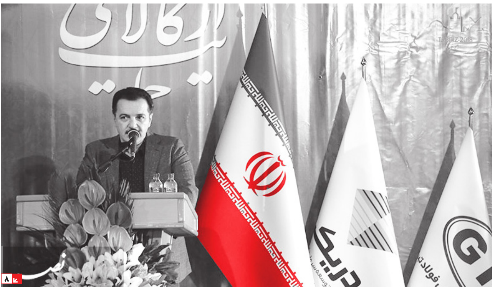
با حضور معاون هماهنگ کننده سپاه عاشورا: