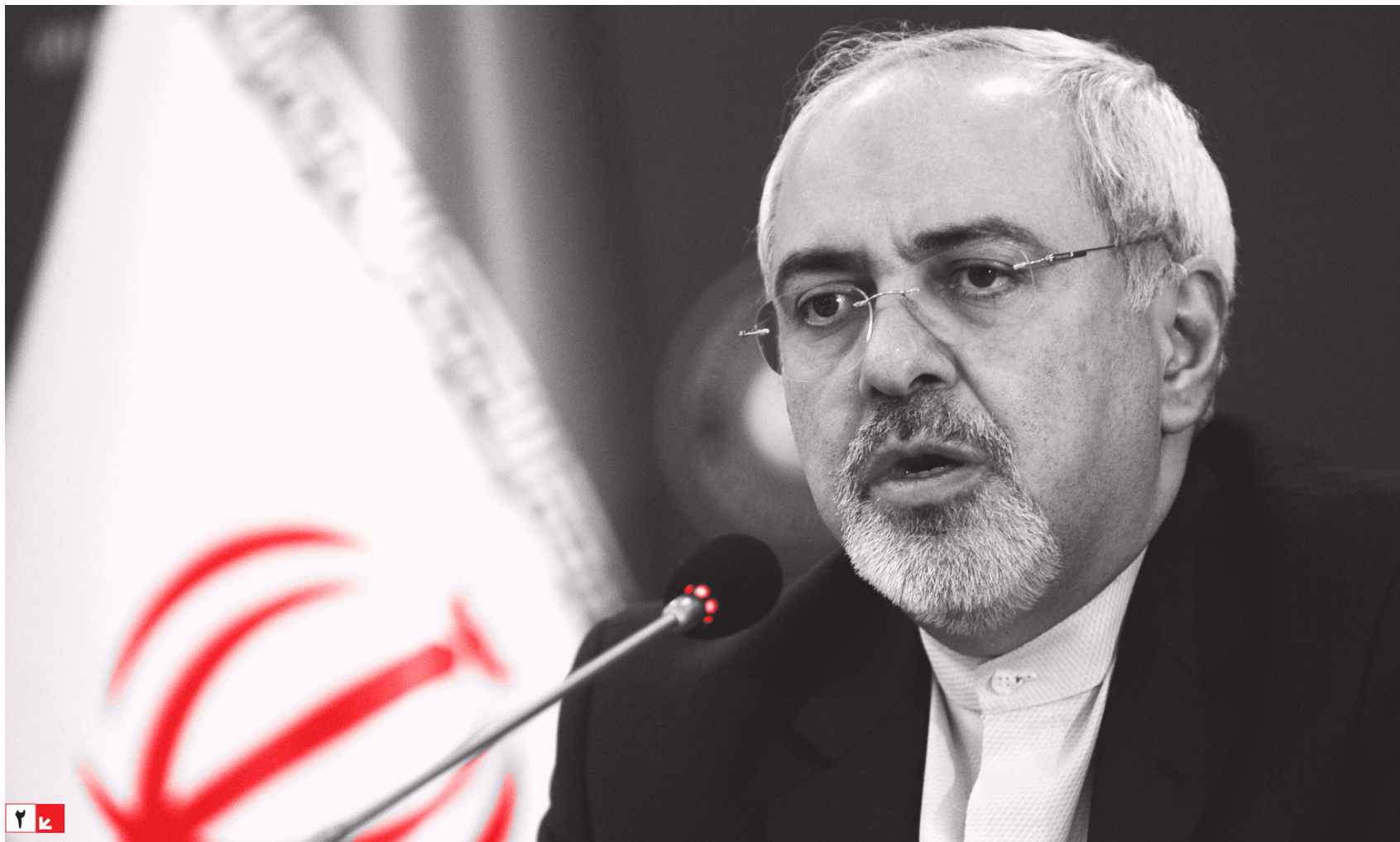
محمد سربق القلم: