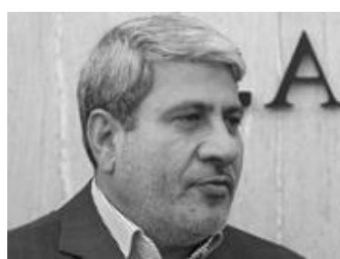
حذف پروازهای چارتری نیاز به بررسی کارشناسانه دارد