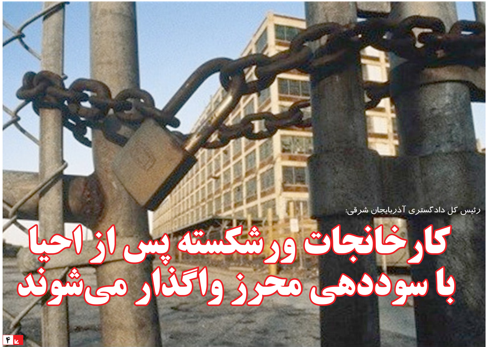
رئیس کل دادگستری آذربایجان شرقی:

تعدادی از مدیران استان در کمیسیون اقتصادی مجلس حضور یافتند تحمل بخش خصوصی از حرکات سینوسی بازار به اتمام رسیده در کشور ۶۰۰۰ پروژه نیمه تمام داریم