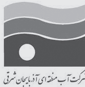
شرکت آب منتهای آذربایجان شرقی