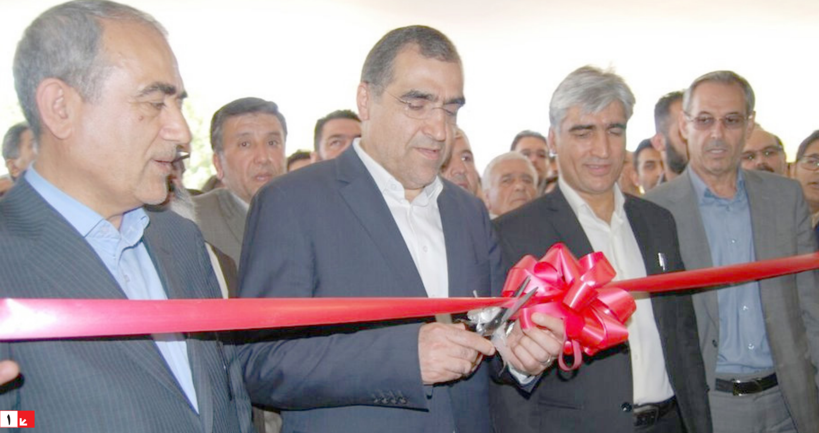
حضور وزیر بهداشت در افتتاح ۶ طرح درمانی در مراغه

تازه‌های فبر احیای دریاچه ارومیه با همراهی مردم و دولت ممکن است معاون محیط طبیعی حفاظت محیط زیست آذربایجان شرقی با تاکید بر لزوم احیای زیست بوم دریاچه ارومیه گفت: روند بحران خشک شدن دریاچه ارومیه باید متوقف و مدیریت شود و این زیست بوم با مشارکت مردم و دولت و همراهی آنها قابل احیاست. به گزارش ایرنا، میر محسن حسینی قمی در نشست تخصصی و هم اندیشی بحران دریاچه ارومیه با حضور تشکل های زیست محیطی استان و اساتید دانشگاهی، افزود: تاکنون در قالب پروژه های ستاد ملی احیای دریاچه ارومیه، طرح های مختلف از جمله آگاه سازی مردم و جوامع محلی از وضعیت و خطرات خشک شدن دریاچه ارومیه اجرا شده است. حسینی قمی گفت: ضروری است افکار عمومی و مردم را با طرح های احیای دریاچه ارومیه همراه کنیم. وی اظهار داشت: عزم جدی برای احیای دریاچه ارومیه وجود دارد و سازمان های مردم نهاد، دانشگاه ها و مردم باید در این راه در کنار دولت قرار گیرند. دریاچه ارومیه واقع در شمال غرب ایران میان دو استان آذربایجان غربی و آذربایجان شرقی محصور شده است. مساحت این دریاچه در تابستان ۲۰۱۵ میلادی حدود ۶ هزار کیلومتر مربع بود که در ردیف بیست و پنجمین دریاچه بزرگ دنیا از نظر مساحت قرار می گرفت. دریاچه ارومیه، بزرگ‌ترین دریاچه داخلی ایران و دومین دریاچه بزرگ آب شور دنیا محسوب می شود. آب این دریاچه بسیار شور بوده و بیشتر از رودخانه‌های زربنده‌رود، سیمینه‌رود، تلخه رود، گادر، باراندوز، شهرچای، نازلو و زولا تغذیه می‌شود. دریاچه ارومیه از اواسط دهه ۱۳۸۰ شروع به خشکیدن کرد و در مدت کمی وسعت آن به شدت کاهش یافت.