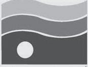
شرکت آب منتهای آذربایجان شرقی