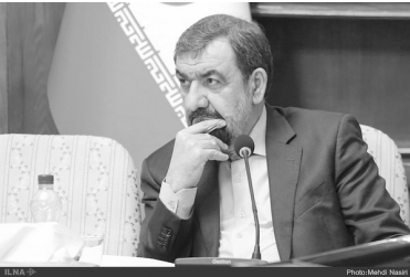
دبییر مجمع تشخیص مصلحت نظام

توقف انتقال حساب سه سازمان در آمدزا با این حال پیگیری خبرنگار ایرنا نشان می دهد کار انتقال حساب های دولتی بویژه دستگاه هایی که در عرف «درآمدزا» شناخته می شوند، به همین سادگی نیست و چند سازمان بزرگ از جمله سازمان امور مالیاتی، گمرک و شرکت پخش فرآورده های نفتی که بخش عمده ای از منابع دولت را در اختیار دارند هنوز حساب های خود را به