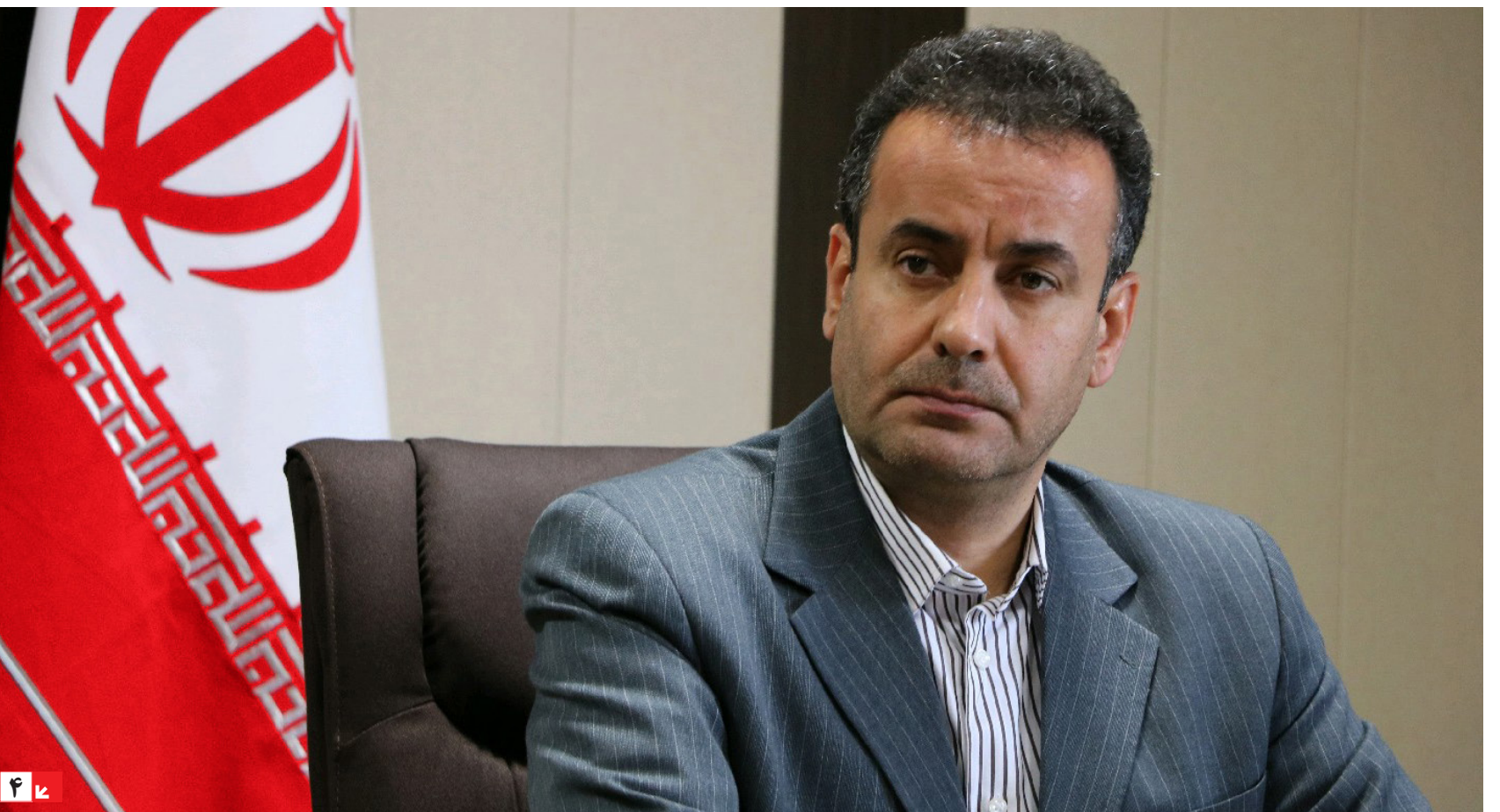
استاندار سابق آذربایجان شرقی: