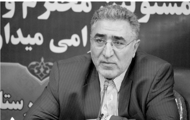
سهال اعتبارات استان کمتر می‌شود.