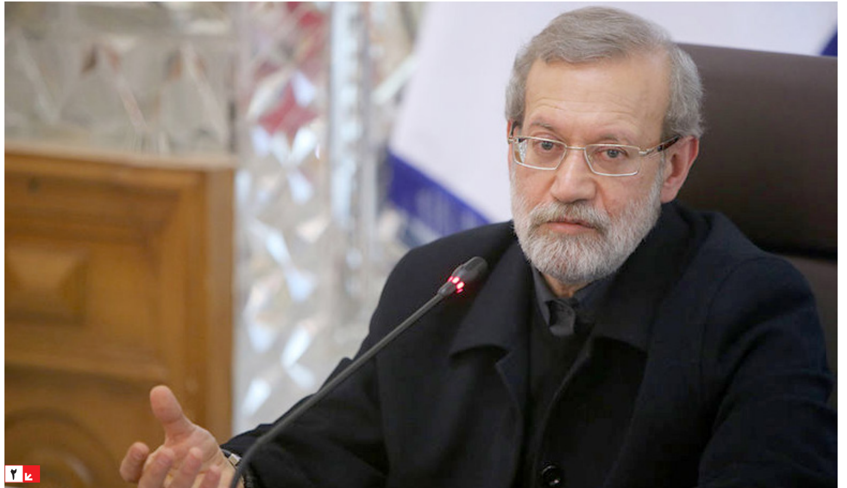
عضو فراکسیون امید مجلس: