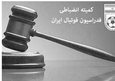
کمیته انضباطی فدراسیون فوتبال ایران

کمیته انضباطی ارای خود را در خصوص تیم های لیگ برتری را صادر کرد.