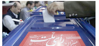
سخنگوی شورای نگهبان گفت که

به گزارش فارس، عباسعلی کدخدایی با اشاره به برگزاری نشست دیروز این شورا، گفت: اعضای هیات مرکزی نظارت بر انتخابات مجلس شورای اسلامی و میان