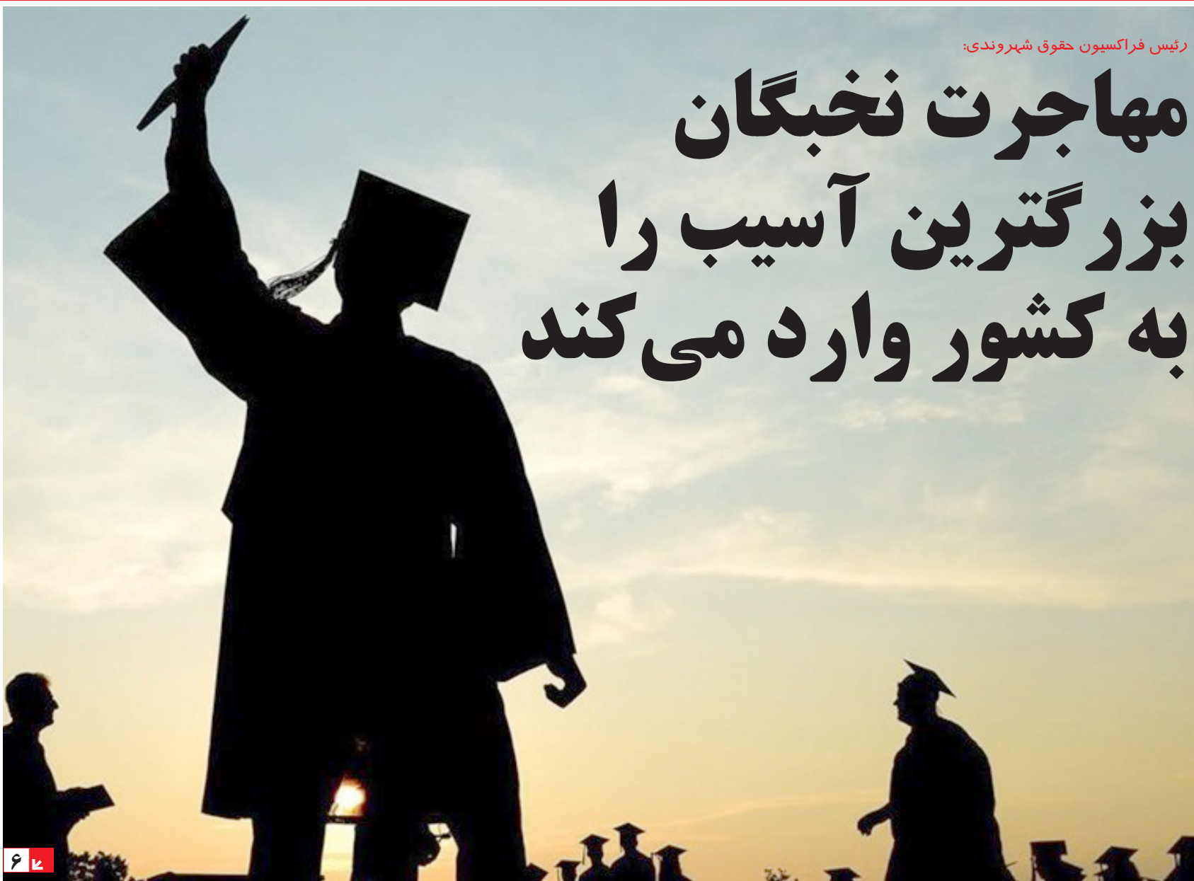
رییس فراکسیون حقوق شهروندی: