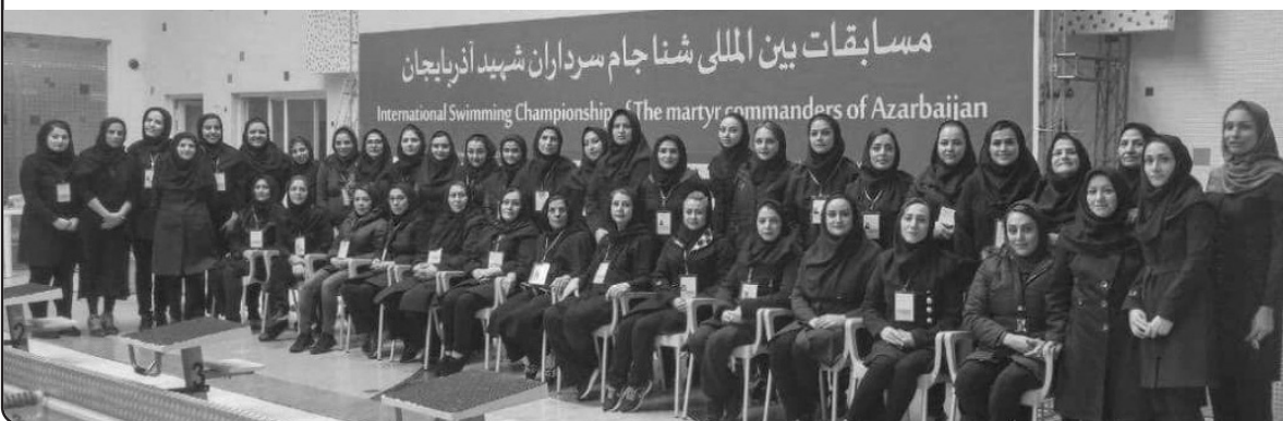
مسابقات بین المللی شنا جام سرداران شهید آذربایجان