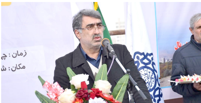
زمان: چه مکان: شا

مشخصات فنی پروژه بلوار ۴۵ متری شهید سردار سپهبد قاسم سلیمانی طول مسیر پروژه: ۱۴۲۰ متر عرض بلوار: ۴۵ متر مساحت مورد نیاز جهت اجرای پروژه: ۶۳۹۰۰ متر مربع تعداد ۱ ماکلک واقع شده در مسیر: ۷۸ ملک خاکبرداری و خاکریزی مسیر پروژه: ۱۸۰ متر مکعب جدول گذاری مسیر پروژه: ۸۵۰۰ متر زیرسازی و آسفالت ریزی: ۳۵۰۰۰ متر مربع احداث پل بزرگ: یک دهنه اعتبار لازم برای تملک و اجرای پروژه: ۴۵۰ میلیارد ریال