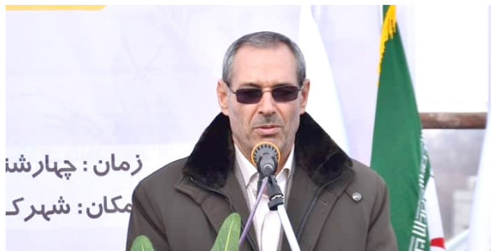
زمان: چهارشنا مکان: شهرک

در سال های آتی شاهد تحول و دگرگونی در شهر مراغه خواهیم بود که این شهر را به مکانی دلپذیرتر برای زندگی و مهاجر پذیرتر از گذشته تبدیل خواهد کرد. دکتر احمد ملکی افزود: در این راستا، بودجه پیشنهادی برای سال آینده شهرداری مراغه با توجه به طرح های بزرگ و تاریخی مشارکتی و زیرساختی به رقم بی سابقه و حدود ۳۰۰ میلیارد تومان خواهد رسید. وی اضافه کرد: از این مجموع، حدود ۱۱۰ میلیارد تومان بودجه شهرداری، ۱۱۰ میلیارد تومان مشارکتی با بنیاد برکت و نیز چهار طرح بزرگ زیرساختی خواهد بود.