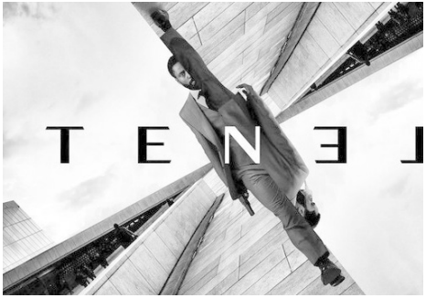
فیلم «Tenet» در نمایشگاه فیلم لندن رونمایی می‌شود.

تا اولین فیلم مهمی باشد که پس از بازگشایی سالن های سینما به نمایش گذاشته می شود اما ادامه روند افزایشی موارد ابتلا به ویروس کرونا تاریخ اکران آن را به ۳۱ جولای تغییر داد و در نهایت بحران جهانی کرونا تاریخ اکران این فیلم را به ۱۲ اوت تغییر داده بود.