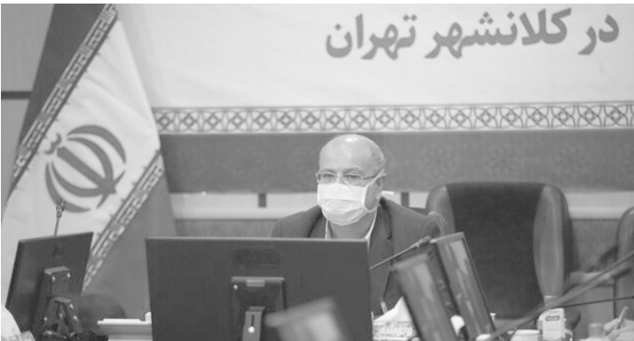
در کلانشهر تهران