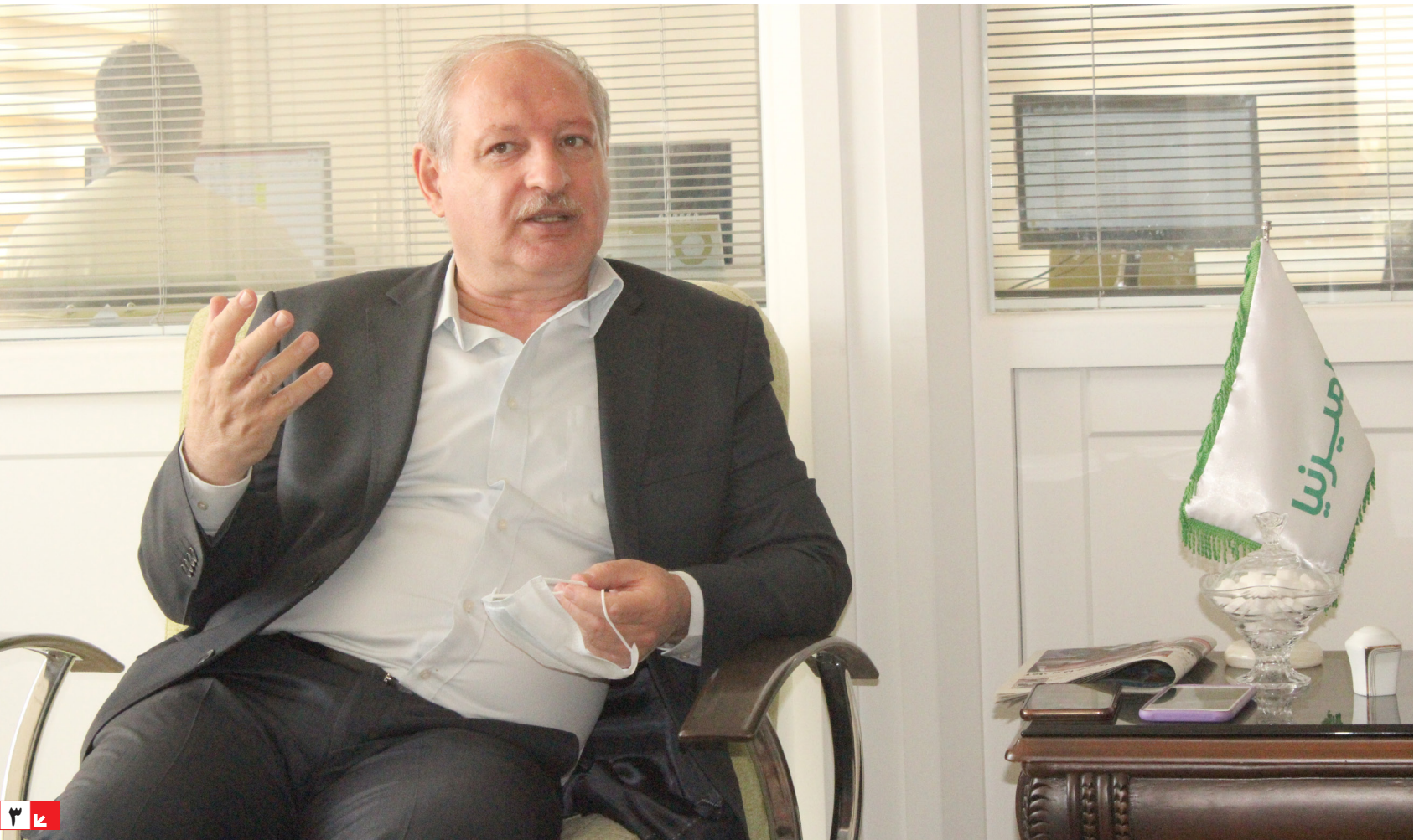
در مصاحبه اختصاصی با نایب رئیس اتاق بازرگانی تبریز مطرح شد: