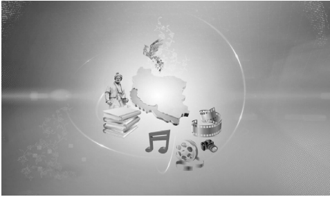
فیلم‌های جشنواره بین‌المللی فیلم مقاومت و درگذشت پرویز پورحسینی هنرپیشه پیشکسوت سینما و تلویزیون بر اثر کرونا را می‌توان از مهمترین رویدادهای فرهنگی هنری هفته گذشته برشمرد.

برگزاری اختتامیه شانزدهمین جشنواره بین‌المللی فیلم مقاومت و درگذشت پرویز پورحسینی هنرپیشه پیشکسوت سینما و تلویزیون بر اثر کرونا را می‌توان از مهمترین رویدادهای فرهنگی هنری هفته گذشته برشمرد. به گزارش ایرنا، هفته‌ای که گذشت حلقه فرهنگ و هنر نیز همگام با محدودیت‌های کرونایی تنگ‌تر شد اما به سبک و سیاق ماه‌های گذشته همچنان شاهد رویدادهای مختلف از افکارآفرینی جهانی هنر تا تلخکامی خیر درگذشت هنرمندی دیگر بود.