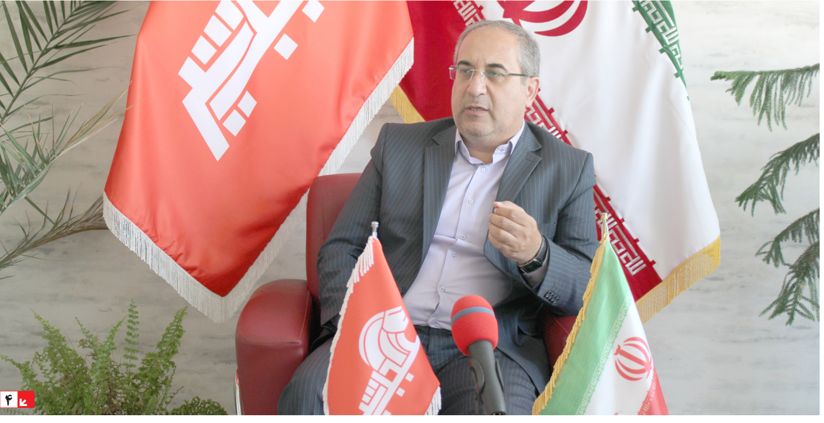
رئیس هیئت مدیره اتحادیه شرکت‌های تعاونی مسکن کارکنان دولت آذربایجان شرقی: