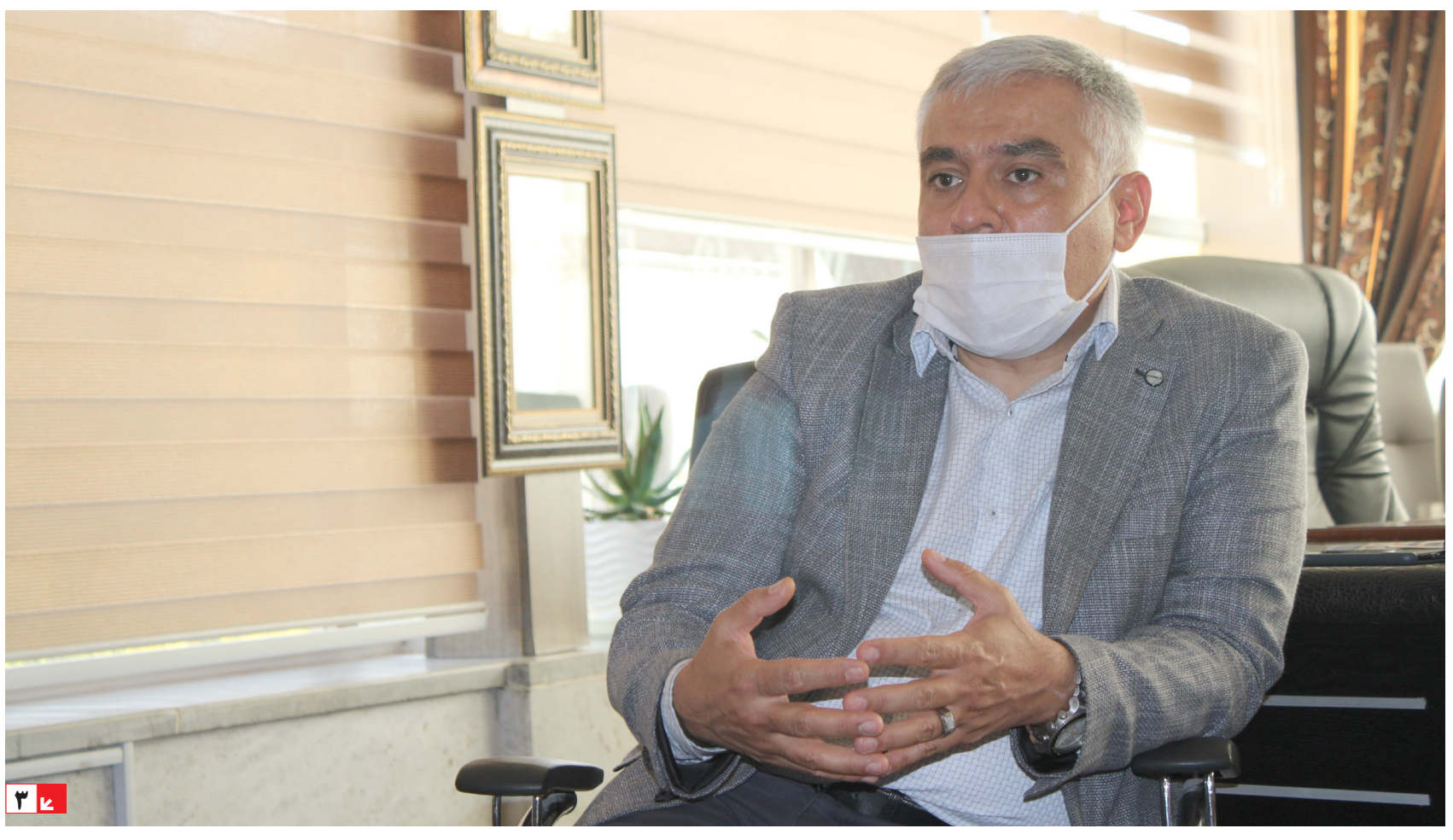
مصاحبه اختصاصی با مدیر عامل «گروه صنعتی پامین»