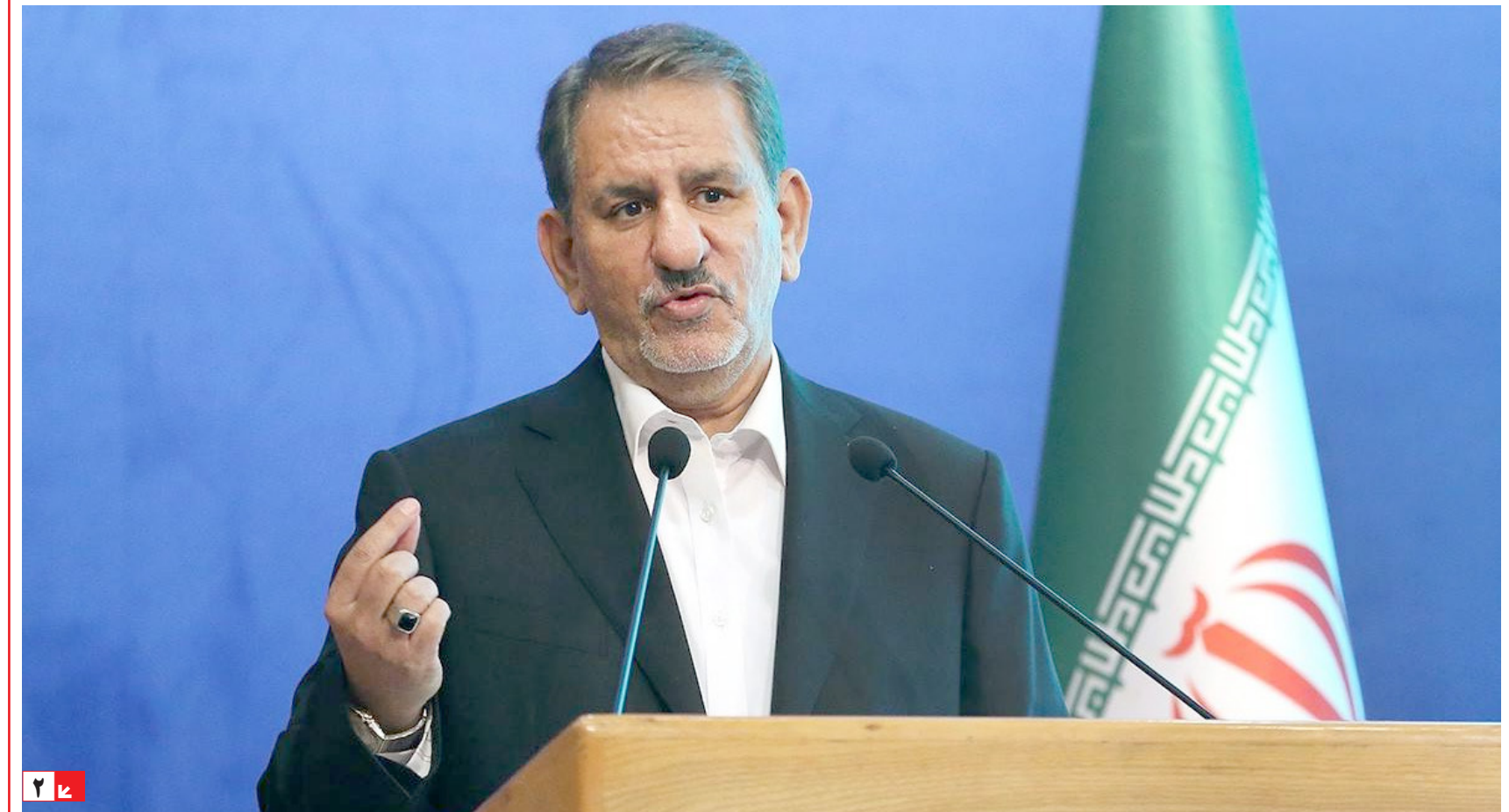
مهر گزارش می دهد: