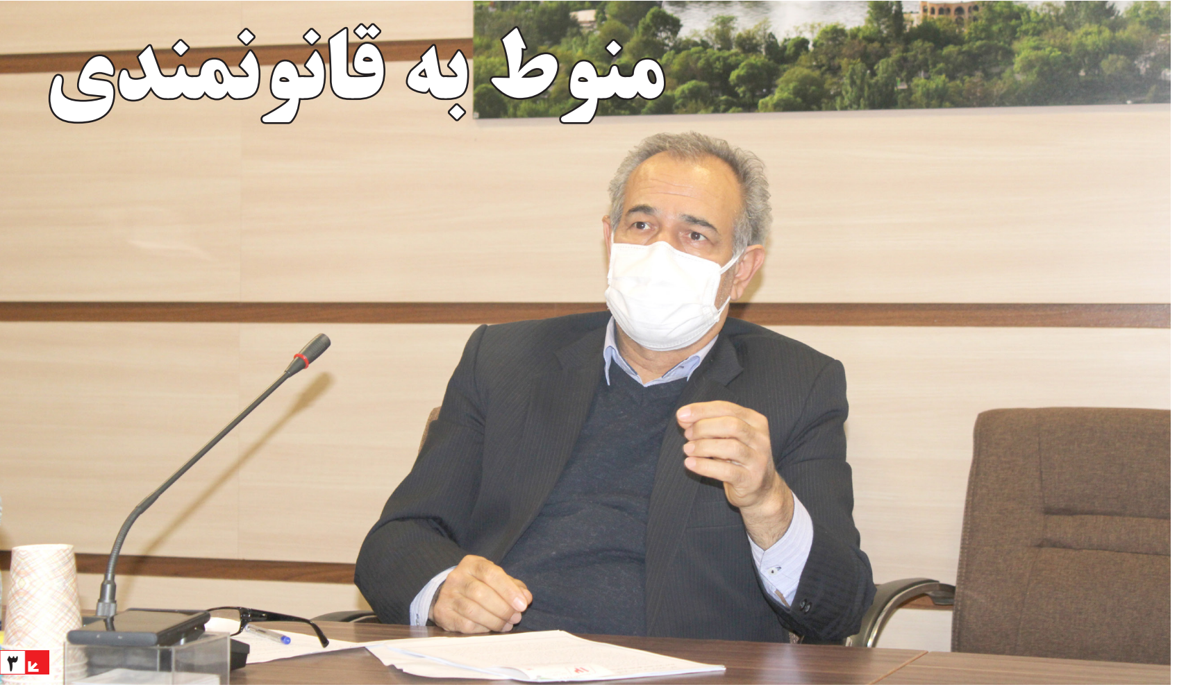
مصاحبه اختصاصی با «معاون هماهنگی امور اقتصادی استانداری آذربایجان شرقی»