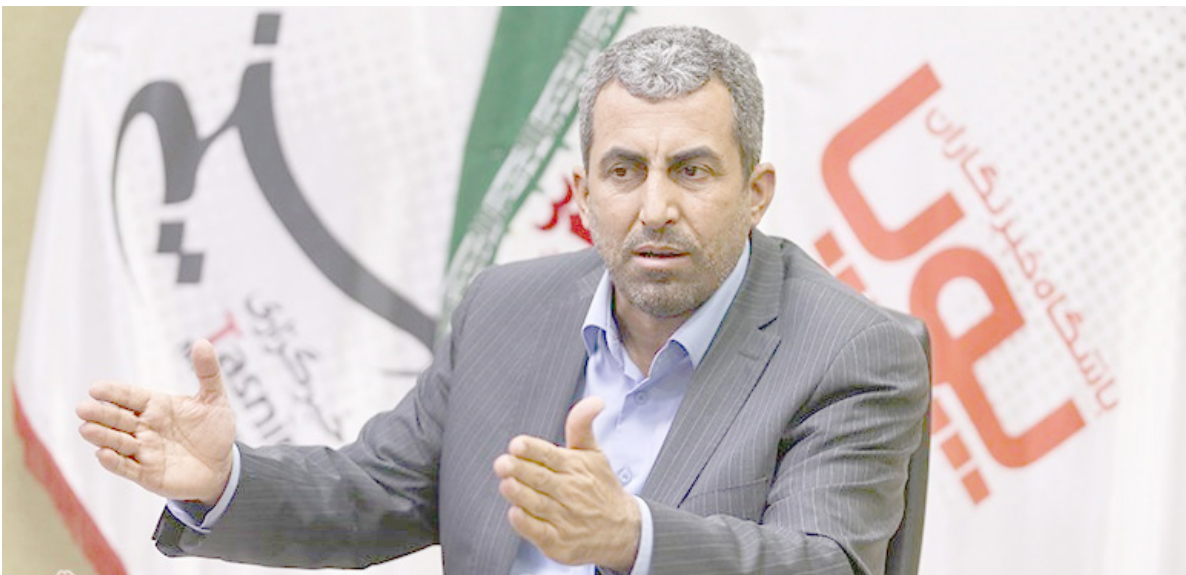
مسیر سخت عبور کنیم.

گفت: مقام معظم رهبری در جلسه‌ای که در خدمت ایشان بودیم به مسئولین دولت فرمودند «شما می‌توانید از طریق عرضه مالکیت سهام شرکت‌های دولتی برای حل مشکل کسری بودجه و برای سرمایه‌گذاری مجدد منابع ایجاد کنید»