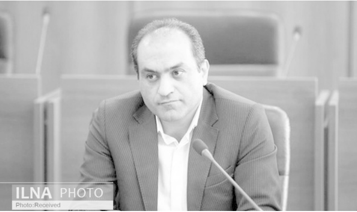
دبیر کمیته اجتماعی انتظامی ستاد ملی مدیریت کرونا