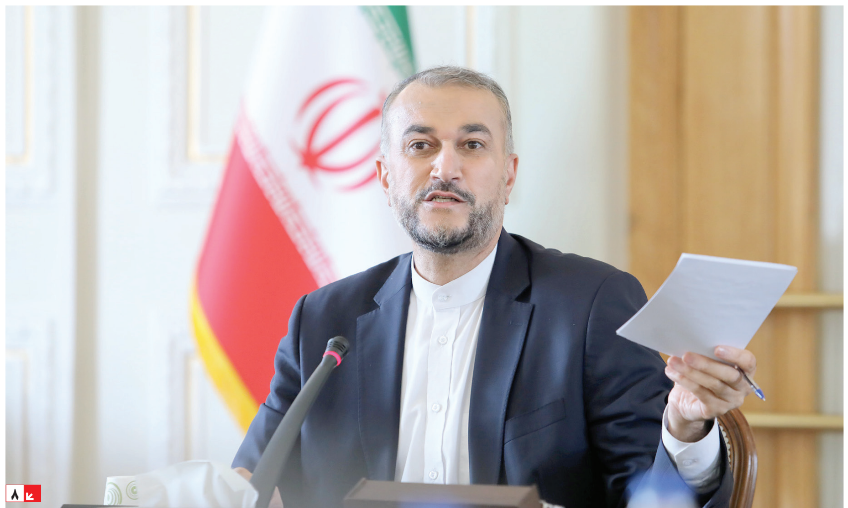
وزیر امور خارجه: