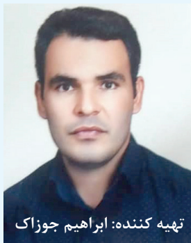
تهیه کننده: ابراهیم جوزاک