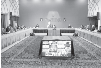
رئیس‌جمهور ایران، آیت‌الله «سیدابراهیم

رحمانی خاطرنشان کرد: تامین اقلام ضروری باعث شد تا در پیک مصرف عید و ماه مبارک رمضان امسال، افزایش قیمتی در سطح استان نداشته باشیم و قیمت اقلام اساسی بر اساس نرخ‌های مصوب تعیین شده نیز ملاک عمل ما در