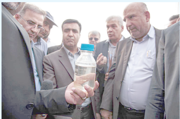
افتخاری دیگر برای خانواده بزرگ توسعه نیشکر؛