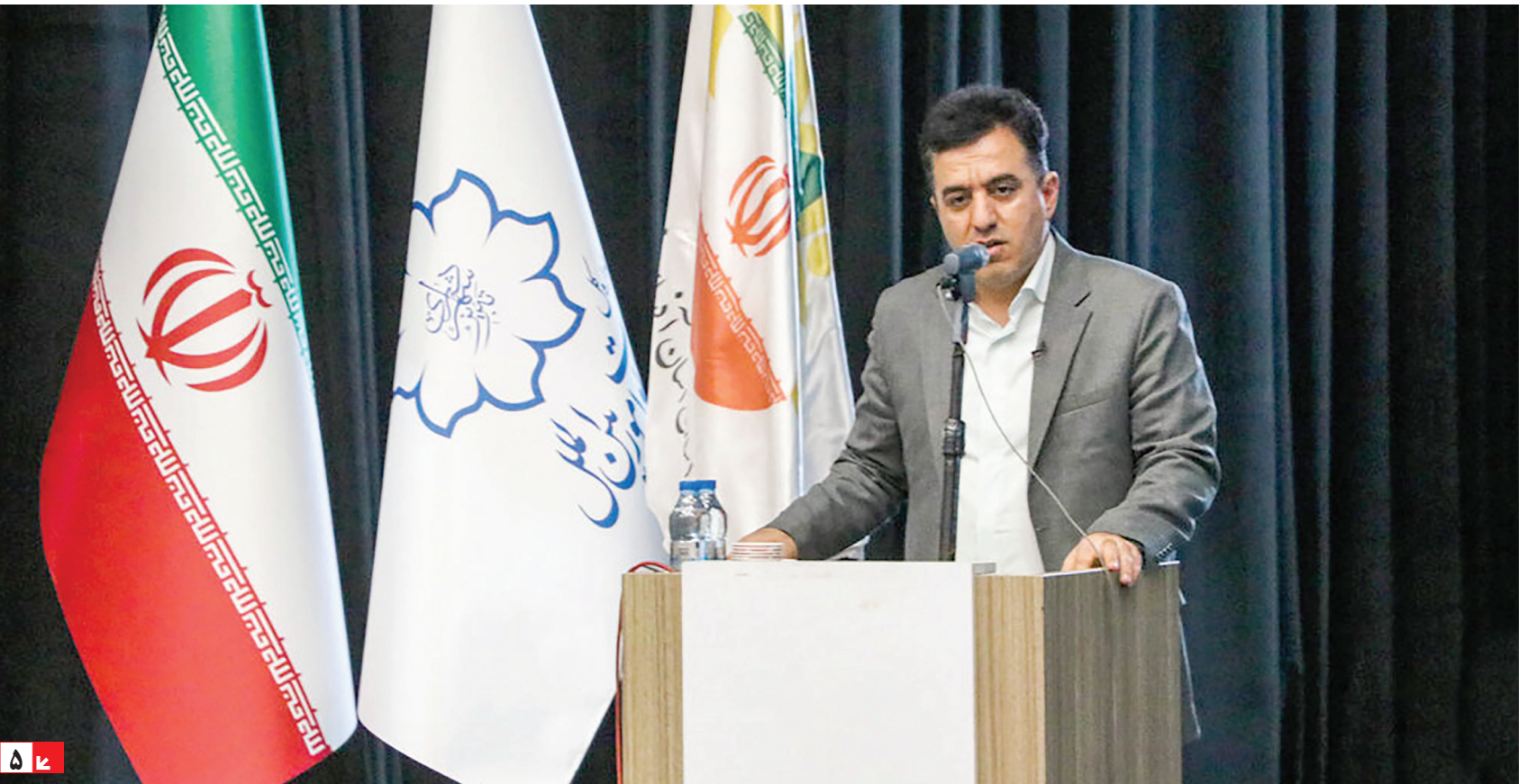
شهر دار تبریز: رئیس سازمان شهرداری‌ها و دهیاری‌های کشور