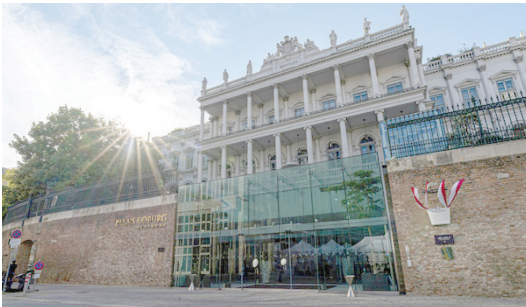
هسته‌های احیا می‌شود.