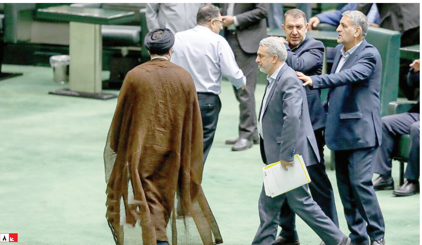
کتابخانه های خالی کوتاه نیامده است