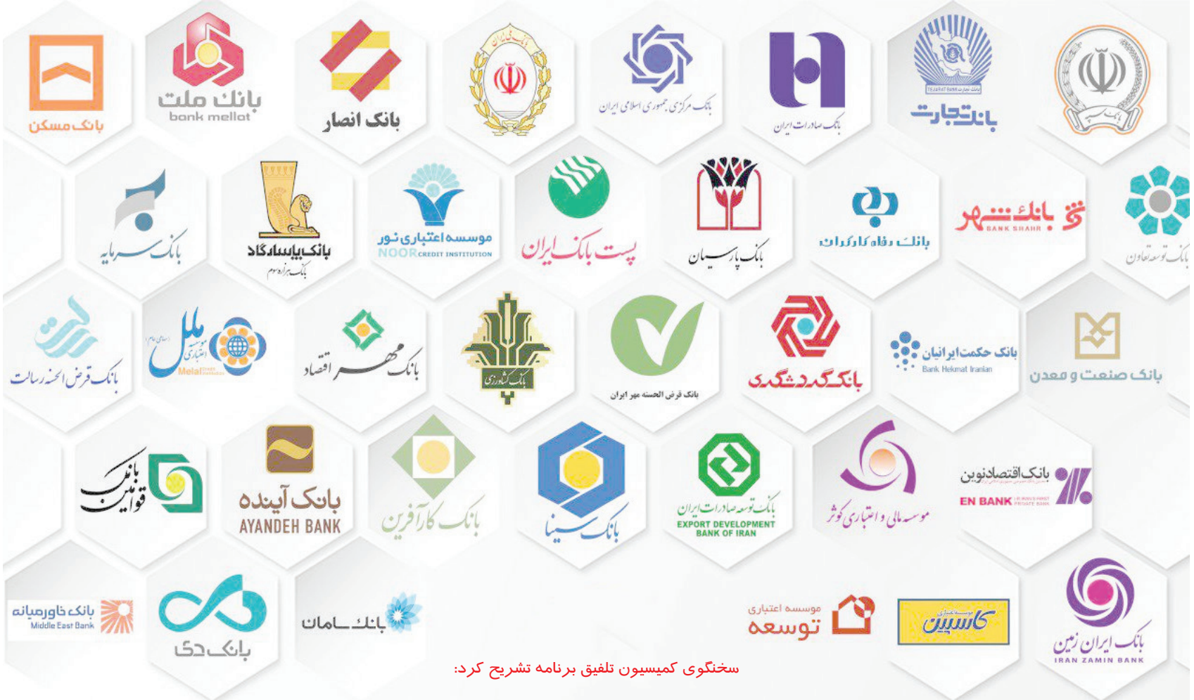
سختگوی کمیسیون تلفیق بر نامه تشریح کرد:

روزنامه عجب شیر به منظور توسعه فعالیت‌های مطبوعاتی خود در تمامی شهرهای ایران نماینده و خبرنگار می‌پذیرد ۰۹۱۴۳۰۱۰۵۷۳