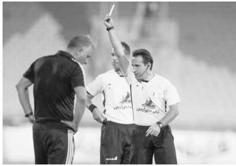
رییس کمیته داوران می‌گوید هنوز ۴ داور ملی