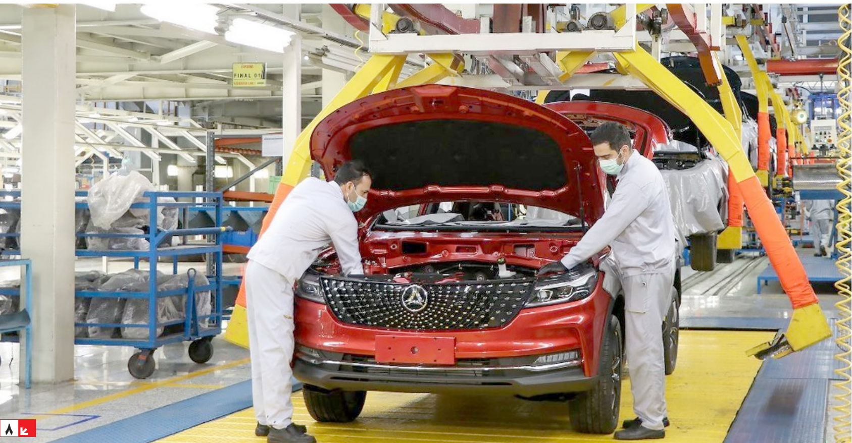
کارگران در حال مونتاژ خودرو در خط تولید