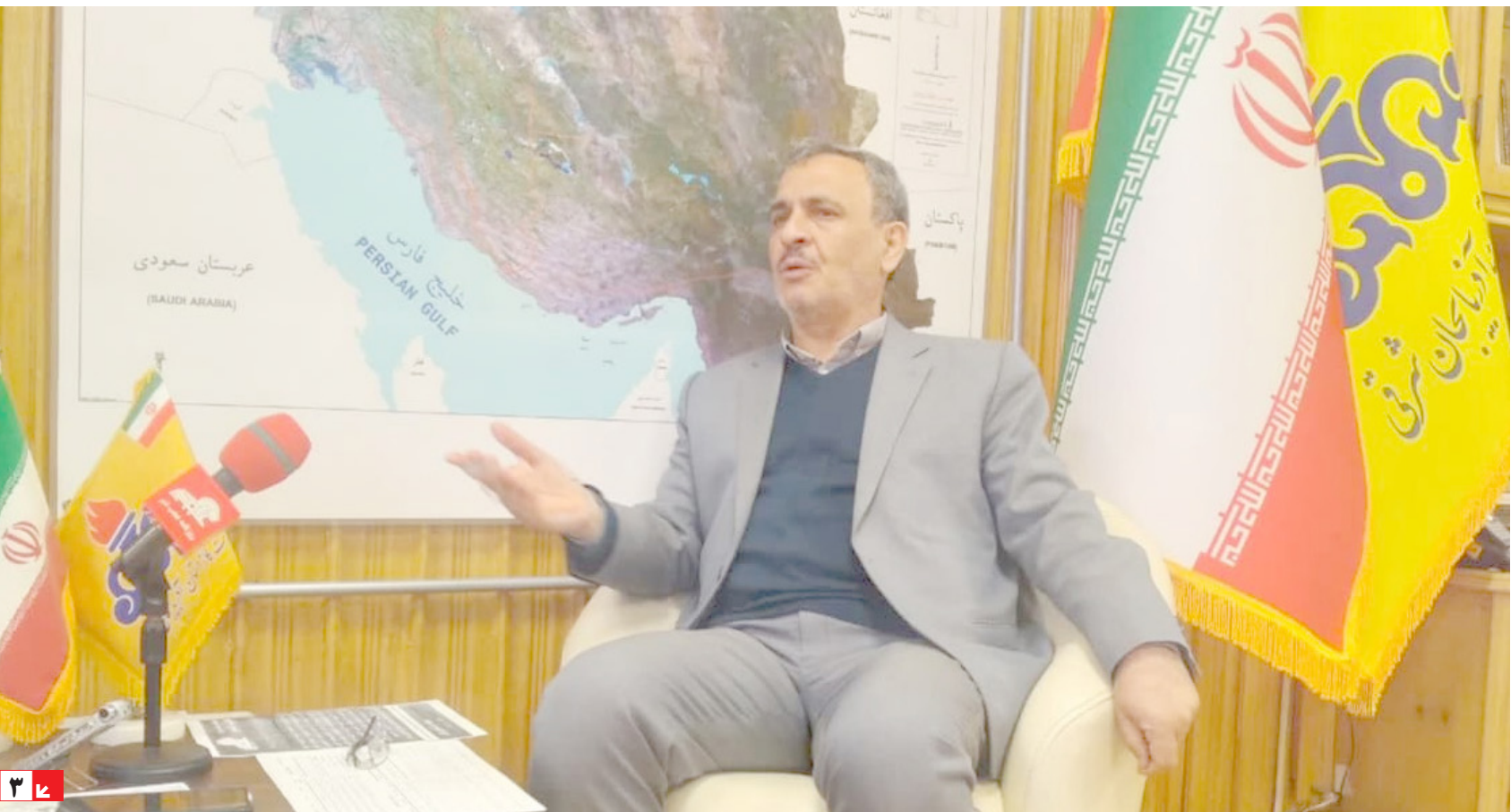
مدیر عامل شرکت گاز استان آذربایجان شرقی در گفتگوی اختصاصی با روزنامه عجب شیر: