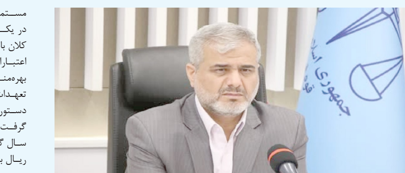
رئیس دادگستری استان تهران از استرداد حقوق بیت المال در پرونده یکی از بدهکاران کلان بانکی ۴۰۰ میلیارد ریال خبر داد.

مستمر دستگاه قضا خیر داد و عنوان کرد: در یکی از پرونده های مرتبط با بدهکاران کلان بانکی، شخص مورد اشاره از تسهیلات و اعتبارات اسنادی داخلی و خارجی یک بانک بهره مند شده بود، اما شخص مذکور به تعهدات خود عمل نکرد و در ادامه موضوع در دستور کار مجموعه قضایی استان تهران قرار گرفت که نهایتا مطالبات کلان این بانک در سال گذشته بالغ بر پنج هزار و ۴۰۰ میلیارد ریال به حیطة وصول درآمد.