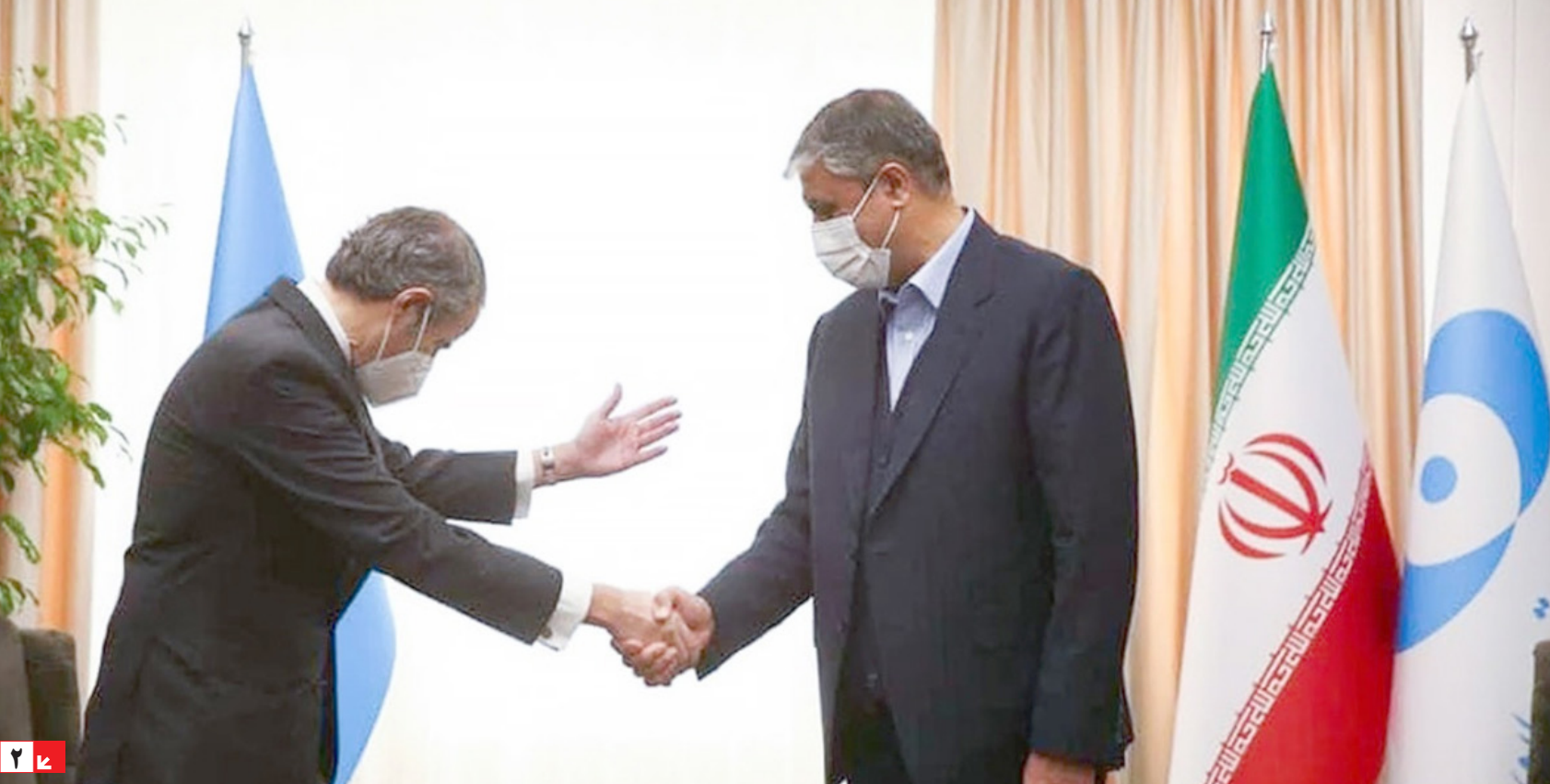
۲ | ۴