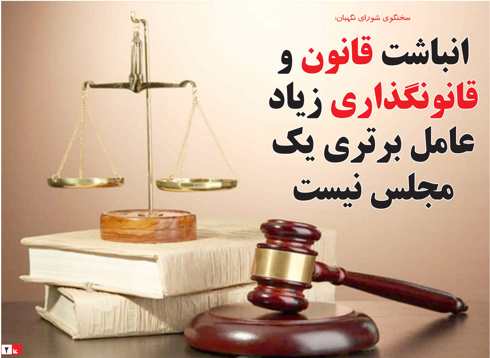
سخنگوی شورای نگهبان: